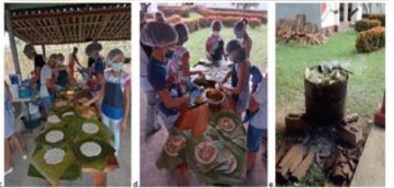
Figura 4. Ecomuseo de la Cerámica Chorotega. (a y b), electrodomésticos y equipo para la cocina, (c y d) talleres de cocina tradicional, (e) cocción de tamales