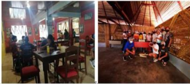
Figura 3. Museo Comunitario de Boruca (a y b) electrodomésticos y equipo para el acondicionamiento de la cocina, (c) área de comedor en remodelación, (d) nueva área de comedor, (e) estudiantes al final taller de cocina tradicional