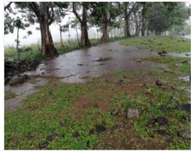
Figura 29. Detalle del escurrimiento de agua en el sitio arqueológico Batambal durante una precipitación características normales en la zona de Palmar Norte (Octubre 2020)